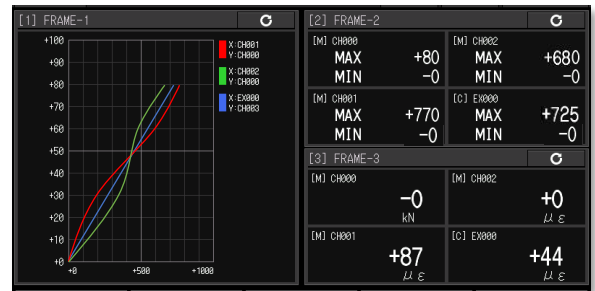
荷重-ひずみ線図 ※イメージ