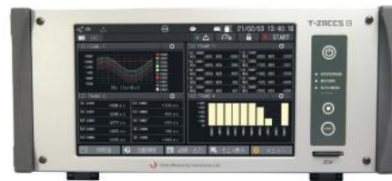
NEW データロガー T-ZACCS 9 TS-960