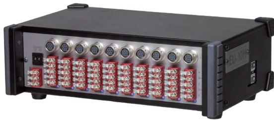
T-ZACCS UNIT EU-10H

T-ZACCS9 TS-963/-960と組合わせて測定点数を拡張するための測定ユニットです。測定点数は10点で、ひずみゲージをはじめ、ひずみゲージ式変換器、熱電対、白金測温抵抗体、直流電圧などの測定が可能です。当社独自の高精度・高安定と高速測定を両立する次世代A/D方式とEthernetをベースとした超高速フィールドネットワークの採用により、各種熱起電力、増幅器の零点移動、商用電源ノイズを除去し、高精度で高安定な測定を実現しながら、測定点数に関係なく、高速モードは0.1秒、高精度モードは0.4秒(50Hz)で測定することができます。