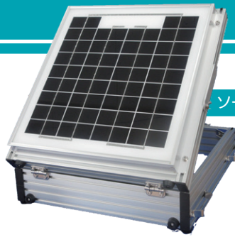
ソーラーパネル・バッテリー付き架台