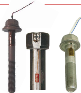
축력 볼트 고온용QF/ZF/EF시리즈